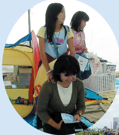
お客さん、意外に肩こってますね。

プラバンと紙粘土でビーズを作り、アクセサリーにします。貝殻で作るアクセサリーもあります。たくさん作ってね！ (ちくちく)