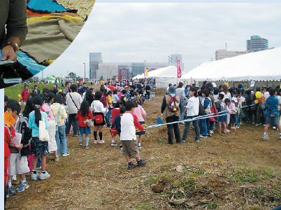
はあーい、皆さん一列に並んで下さーい