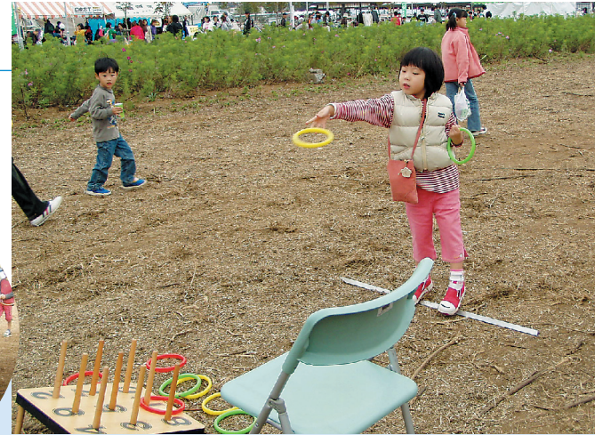
ダーツ、輪投げ、吹き矢など、いろいろなゲームを楽しめました。(よか時感工房)

いろんな模擬店を出しました。お味はいかがでしたか？ (Koneco小室ネットワークコミュニティー)