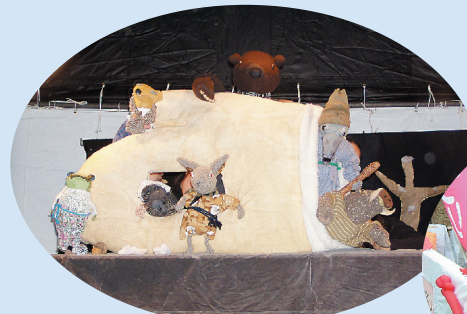
簡単人形をつくってみよう！ やってみよう!! (白井子ども劇場他)

「ミニシアターはらべこくん」、「おおきなかぶ座」が人形劇上演。テントの中は100人近い子どもたち。外では紙コップで人形を作りました。(おはなしカレンダー)