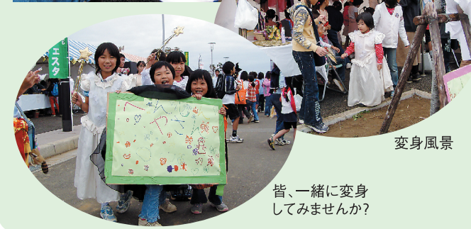
変身風景 皆、一緒に変身してみませんか?